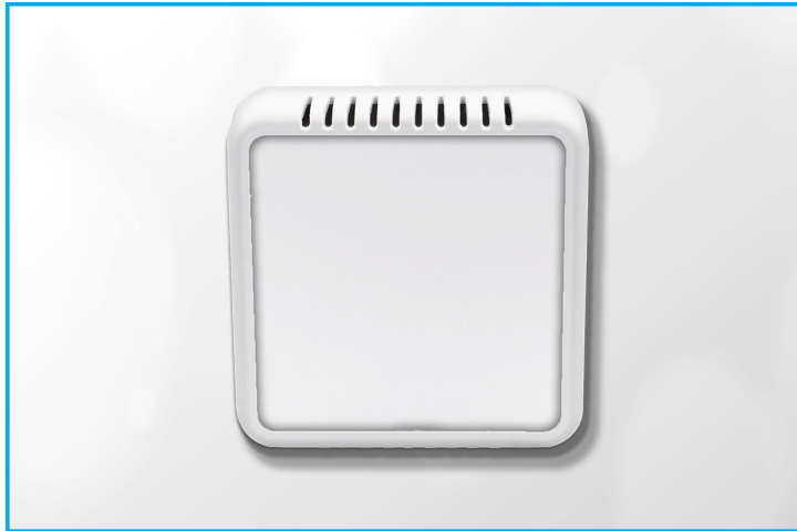
Abb. 1: Innentempersensor TSI-1